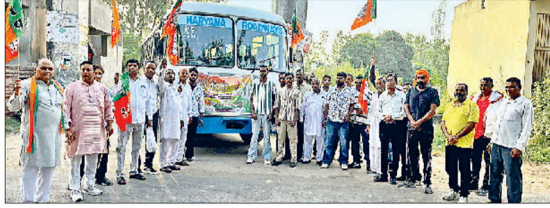
अंबाला। बीसी सम्मेलन में हिस्सेदारी करने के लिए जाते कार्यकर्ता।