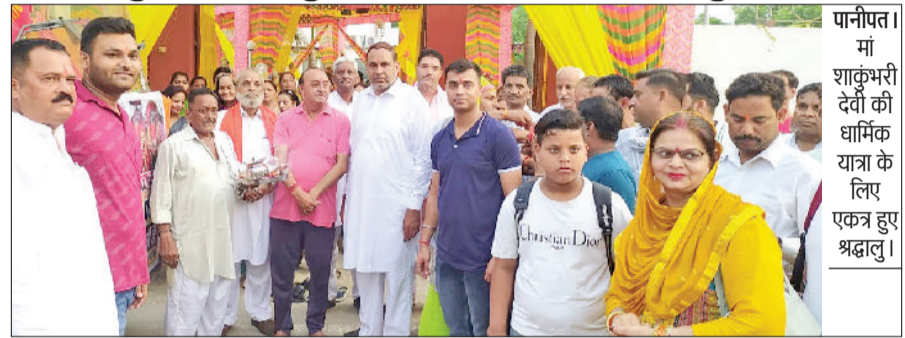
पानीपत। मां शाकुंभरी देवी की धार्मिक यात्रा के लिए एकत्र हुए श्रद्धालु।