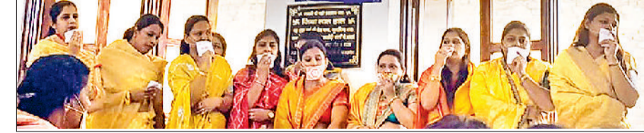
पानीपत जैन स्थानक में जैन साधियों का स्वागत करते हुए श्रद्धालु।