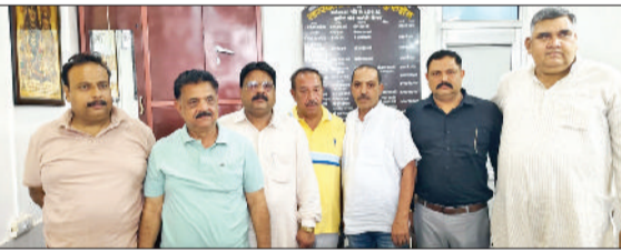
कुरुक्षेत्र। बिरला मंदिर को बचाने के लिए बैठक करते प्रतिनिधि, पूर्व पार्षद और गणमान्य।