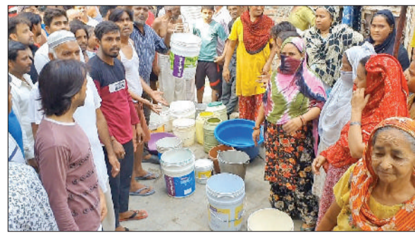
पानीपत। पानीपत के अशोक विहार के निवासी बिजली व पानी के लिए प्रदर्शन करते हुए।

पानीपत की अशोक विहार कालोनी में बिजली- पानी की समस्या को लेकर स्थानीय निवासियों ने मंगलवार को पानीपत प्रशासन के खिलाफ खाली बर्तन, बाल्टी, टब आदि लेकर प्रदर्शन किया है। प्रदर्शनकारियों का दावा है कि पिछले छह माह से कालोनी में पेयजल की आपूर्ति बाधित है, जबकि नर्मो शुरू होने से लेकर अब